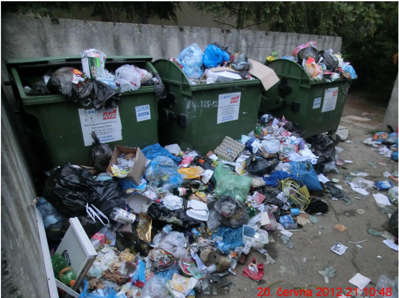
A bombónek nakonec ! Výsledky „vlastního řešení“ radnice za 15 měsíců.